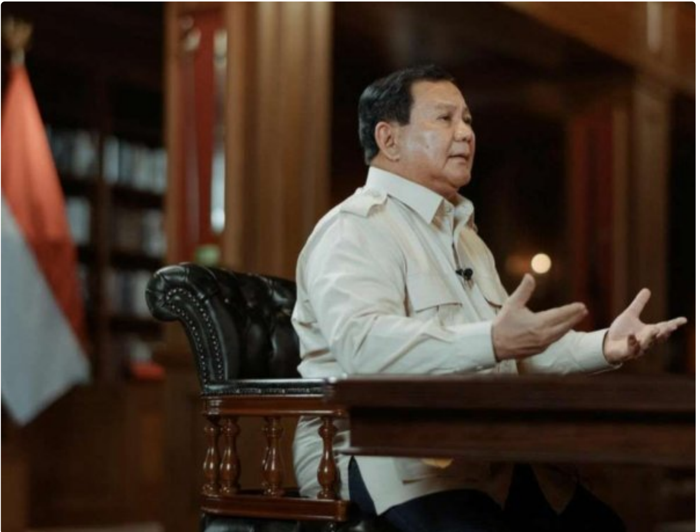
Prabowo Subianto Presiden RI 2024-2029

PENDIDIKAN - Indonesia dikenal sebagai negara yang kaya akan sumber daya alam. Dari hasil tambang yang berlimpah, laut yang luas dengan kekayaan hayati yang melimpah, hutan yang menjadi paru-paru dunia, hingga sumber daya energi yang tersebar di berbagai wilayah, semuanya menjadi kekuatan besar bagi bangsa ini. Potensi besar tersebut seharusnya dapat dimanfaatkan untuk